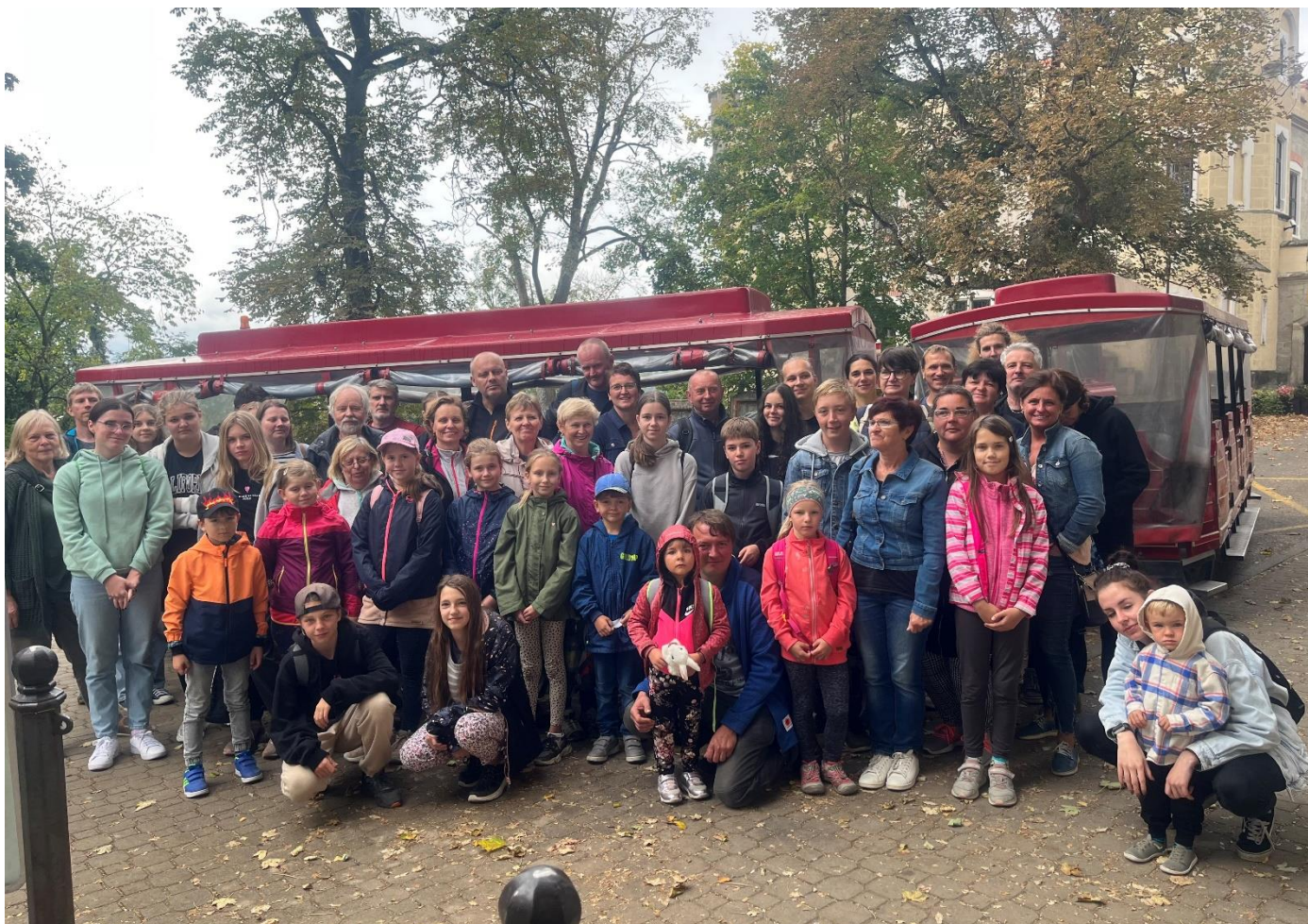
Účastníci zájezdu ZA KRÁSAMI NAŠÍ VLASTI.