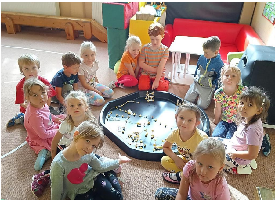
Koukejte, co jsme vyrobili z brambor.