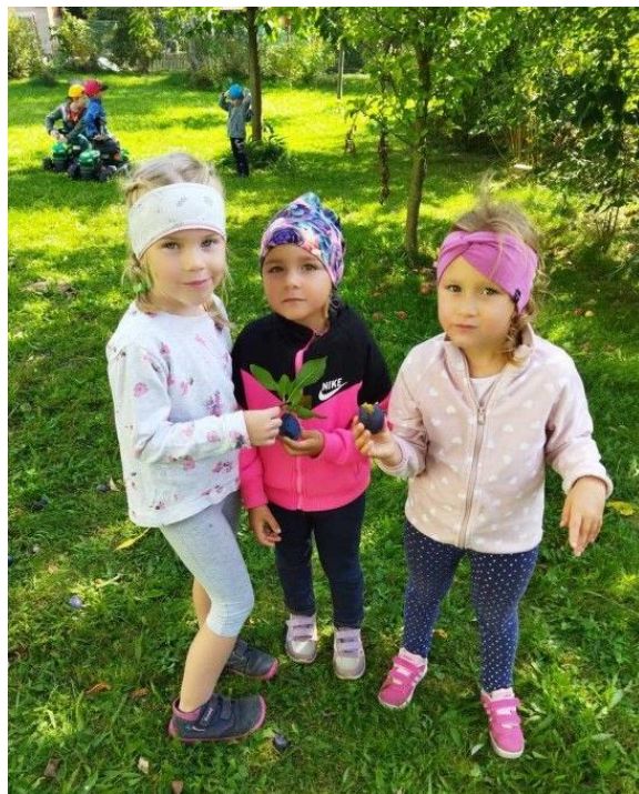
Ochutnávka ovoce ze školní zahrady.

Měsíc září bývá zasvěcen nastavení společných pravidel soužití ve třídě a v okolí školky. Připomínali jsme bezpečné chování při