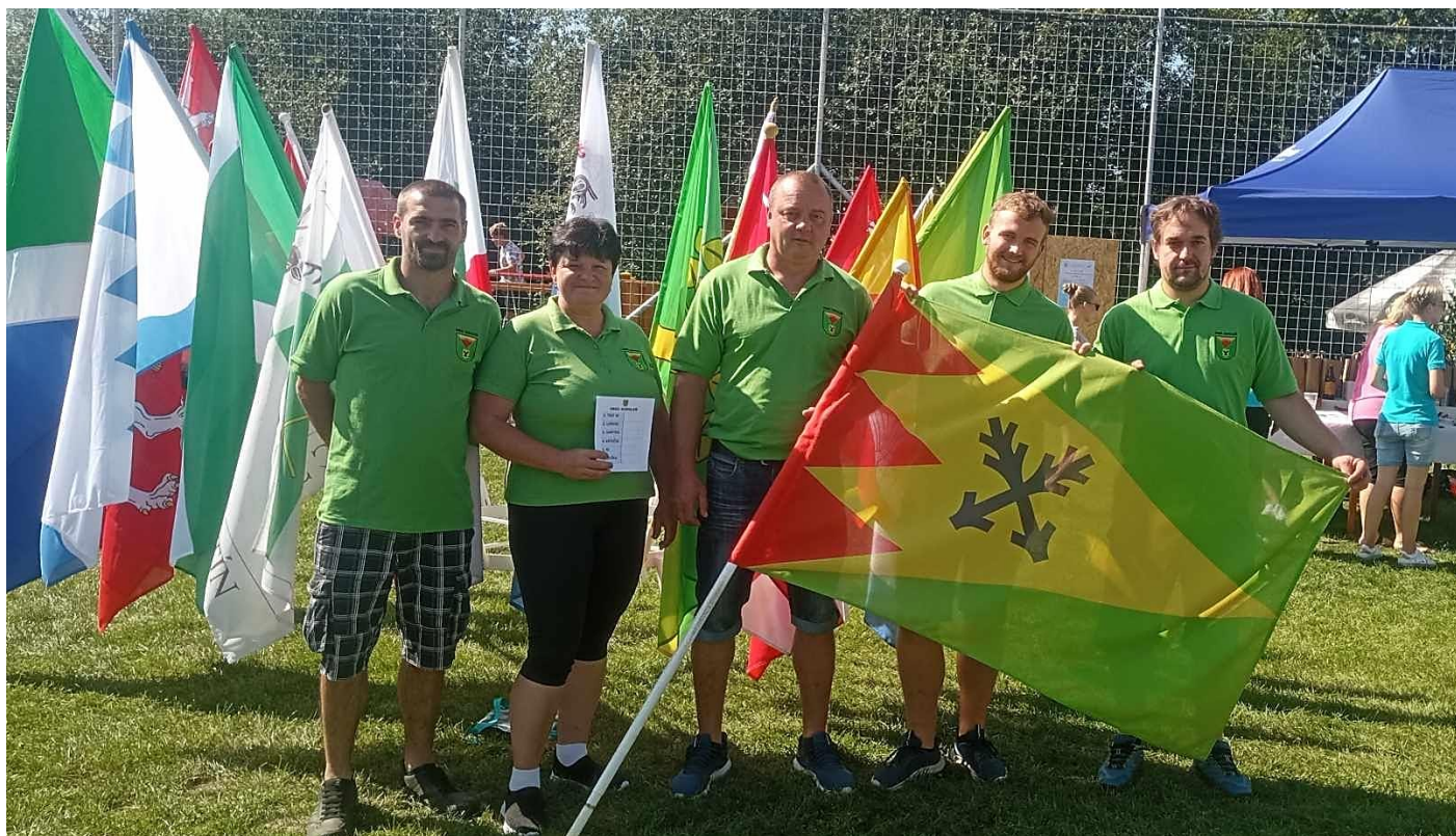
Zástupci obce na Podoubravském víceboji.