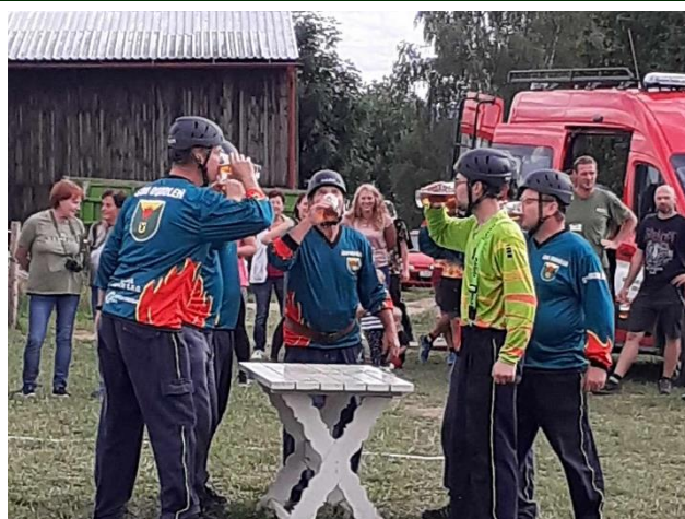
Zdálo by se, že to nemůže být problém, ale když je to na povel...