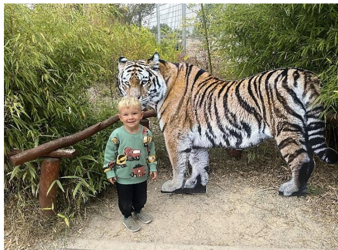
Nejmłodší účastník zájezdu.